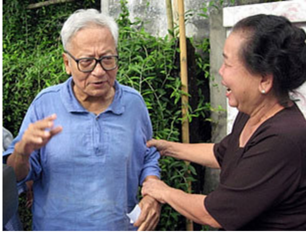
ဒီနေ့လွတ်လာတဲ့အကြောင်းလေးများ ကျွန်တော်ကိုပြောပါလားဆရာရယ်

အဲဒီနေ့မနက် ကျွန်တော်ကို အစောကြီး လာပြောတယ်။ လွှတ်ပေးမယ်။ ပစ္စည်းတွေ ဘာတွေပြင်ပါလို့ လာပြောတယ်။ ထောင်မှူး အဲဝင်းကိုတာဝန်ခံတဲ့သူက။ ကျွန်တော်ကပြောတယ် - မလုပ်နိုင်ဘူး။ ဟောဒီမှာ ကျွန်တော်စာအသင့်ရေးပြီးသားရှိတယ်။ အဲဒီစာကိုပေးလိုက်ပါ။ အဲဒီစာက ဘာလဲဆိုရင် 'အိုနာကျိုးကန်း စီမံကိန်း' နဲ့ လွှတ်ပေးမယ်ဆိုတဲ့ဟာ ဒါကိုကျွန်တော်လက်မခံနိုင်ဘူး။ နှစ် က ဘာလဲဆို လက်မှတ်ထိုးပြီးထွက်ရမယ်ဆိုတဲ့ ၄၀၁ ပေါ့ဗျာ။ အဲဒါကို ကျွန်တော်လက်မခံနိုင်ဘူး။ ကျွန်တော်မထွက်နိုင်ဘူး။ ခင်ဗျားတို့ ဆွဲထုတ်ချင်ရင်ဆွဲထုတ် ကျွန်တော်က ထောင်အဝတ်အစားကစပြီး