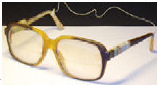
ဦးဝင်းတင်အသုံးပြုခဲ့သောမျက်မှန်