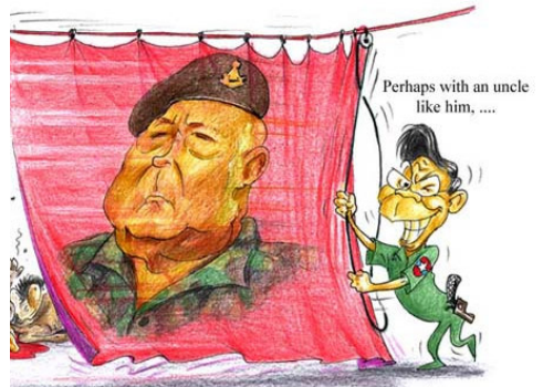
Perhaps with an uncle like him, ....